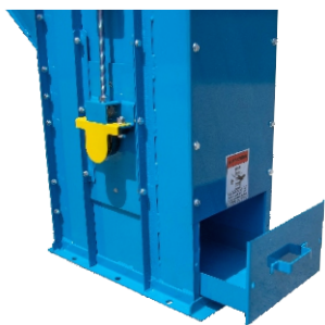
Sistema de limpiado Facil.